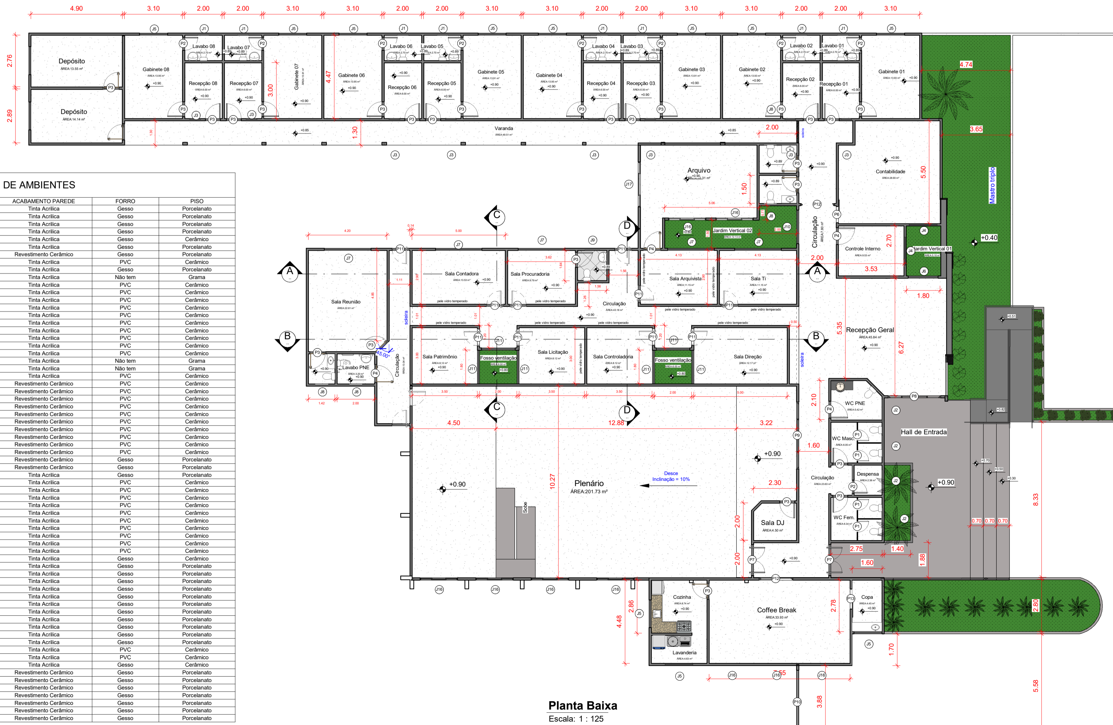
Planta Baixa Escala: 1 : 125