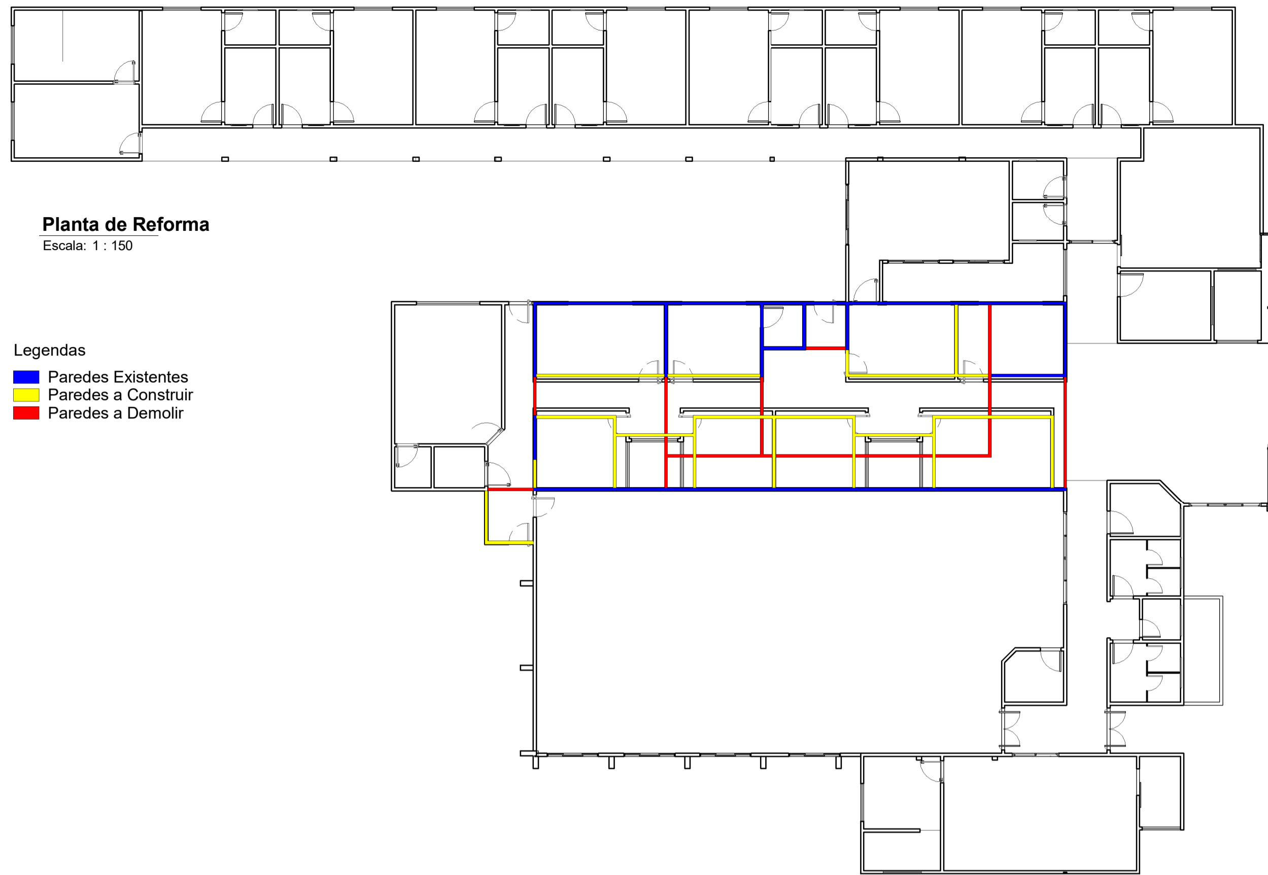
Planta de Reforma Escala: 1 : 150